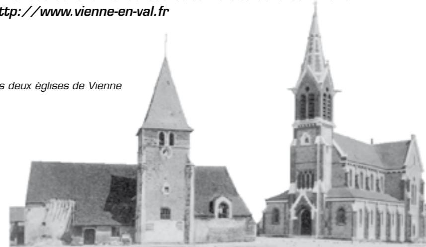
les deux églises de Vienne