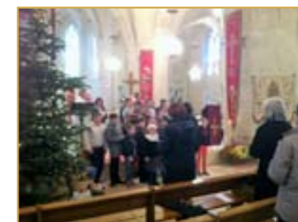
Messe familiale de l'Avent Opération « Noël pour tous » Les enfants ont offert un de leurs jouets à ceux qui n'ont pas la même chance qu'eux.