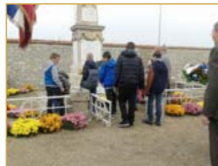
11 novembre avec la participation d'enfants du catéchisme