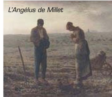
L'Angelus de Millet

Elles sonnent seules ou chantent en carillon, comme une chorale de voix de bronze. Elles racontent la vie, le temps, l'heure, annoncent les baptêmes, les mariages et aussi les obsèques. Elles « carillonnent » les joies et « tintent » les peines. Elles signalent même les incendies et annoncent les guerres en devenant « tocsin ». Elles célèbrent les fêtes chrétiennes.