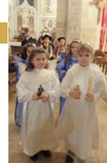
Veillée de Noël