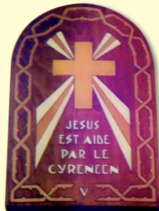
Eglise de Grangermont

D'un point de vue artistique, beaucoup d'intérêt a été montré au cours des siècles pour l'analyse, la conservation et la restauration des représentations du Chemin de Croix. Les 14 tableaux qui le composent en général ont été installés à l'intérieur ou à l'extérieur des églises : peintures, gravures, bas-reliefs, sculptures, fresques ou simples croix numérotées. Certains sont de véritables œuvres d'art exécutées par des peintres et sculpteurs célèbres mais aussi par des artistes et artisans locaux.