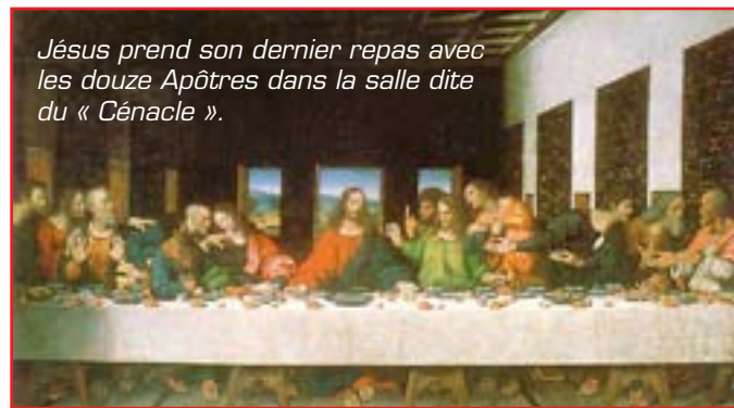
Jésus prend son dernier repas avec les douze Apôtres dans la salle dite du « Cénacle ».