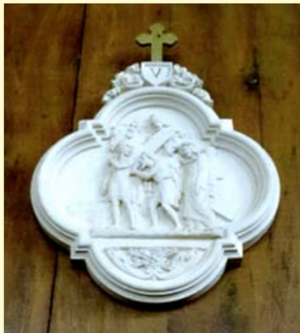
Eglise de Bazoches les Gallerandes

Pendant des siècles, Jésus fut représenté portant sa croix toute entière sur l'épaule et, pendant son trajet vers le Calvaire, il fut aidé par Simon de Cyrène. Au XX ème siècle, s'est répandue l'idée qu'il avait pu ne porter, comme tous les condamnés dont les deux larrons crucifiés en même temps que lui, que la partie supérieure de la croix ( le patibulum ), de la ville au Golgotha, attachée aux deux bras et reposant sur les épaules. La partie basse de la croix était préalablement fichée en terre sur le lieu du supplice. Les deux parties de la croix étaient assemblées sur place.