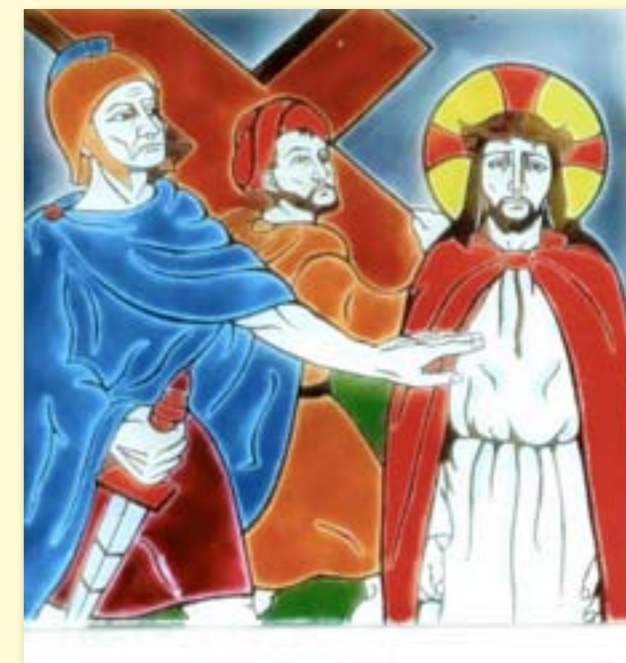
Eglise de Chilleurs aux Bois

Le Chemin de Croix ne serait qu'une tragédie historique ? Mais la 15 ème station nous invite : « Avec Marie dans l'Espérance de la Résurrection du Christ ». C'est ce que nous fêtons à Pâques. De même, à chaque messe, lorsque nous annonçons « Qu'il est grand le mystère de la Foi, nous proclamons ta mort Seigneur Jésus, nous célébrons ta Résurrection et nous attendons que tu viennes ».