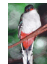
L'oiseau national est le Toco-toco, son plumage rouge, bleu, blanc reproduit les couleurs du drapeau cubain.

Depuis 2015 ont eu lieu les premières élections municipales, marquant ainsi un début d'ouverture à une démocratie qui se mettra en place progressivement dans une vie politique et sociale menée par les opposants du régime actuel autoritaire, tout en restant dans une logique socialiste.