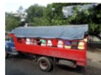
Les transports en commun, mais il y a quand même quelques vieux cars, et des camions militaires recyclés.

Il n'y a aucune régularité dans les transports ; aussi, là encore, c'est la débrouillardise. Il n'est pas rare de voir au bord de la route des personnes agitant des billets pour se faire prendre en stop ; plus les billets sont nombreux, plus ils vont loin, et ça marche !