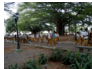
Sortie scolaire, les jeunes portent l'uniforme.

L'enseignement à Cuba est gratuit et obligatoire jusqu'au premier cycle du secondaire, permettant ainsi l'éradication de l'analphabétisme dès 1961.