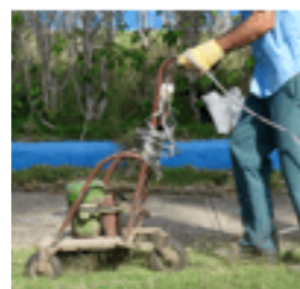
Système D et débrouillardise : il semblerait bien que ce soit une tondeuse !

Compte tenu du peu de moyens des Cubains, tant matériel que pécunier, et des restrictions qui leur sont imposées, c'est le royaume de la débrouillardise et du système D.