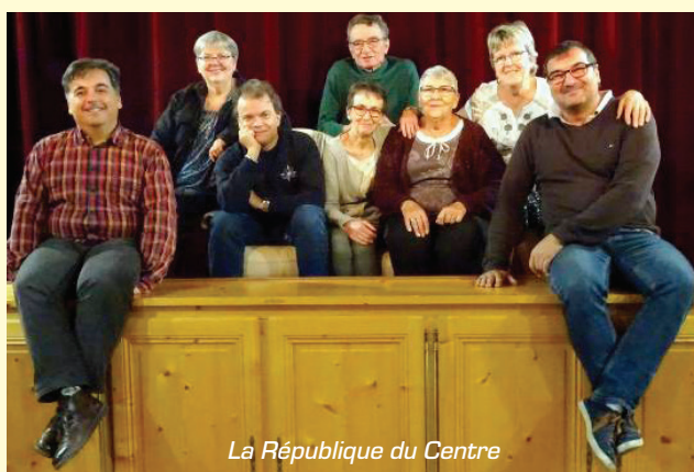
La République du Centre

D'autre part nous faisons appel à toutes personnes désireuses de venir intégrer notre troupe théâtrale, surtout vous Messieurs. N'ayez pas peur appelez le 02 38 80 13 25 dès maintenant afin de mettre en place notre prochaine pièce.