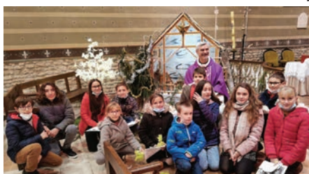
Trinay Messe familiale le 12/12/2020

BOULAY/BRICY : Dimanche 30 mai 9 h 30 à Boulay