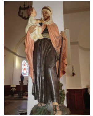
St Joseph Chevilly

Ce 8 décembre 2020 a marqué le 150 ème anniversaire de Saint Joseph Patron de l'Eglise universelle