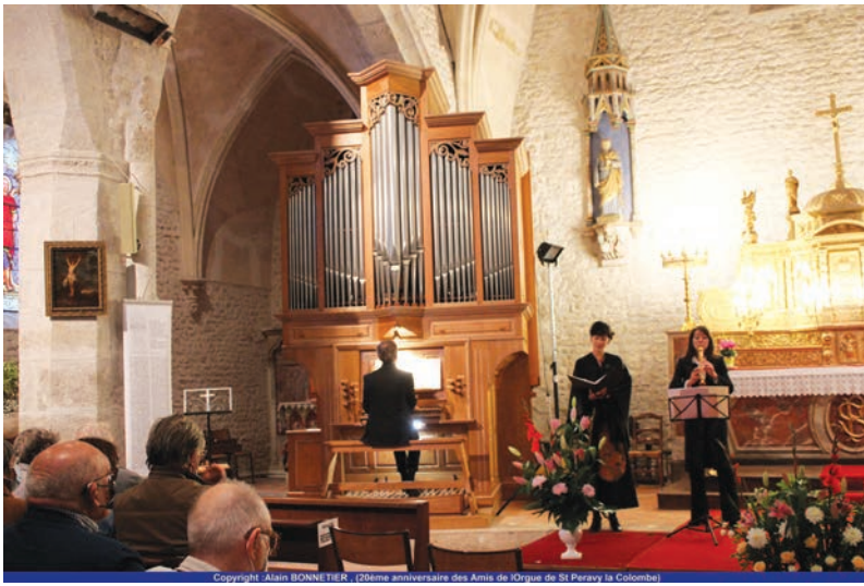
(120ème anniversaire des Amis de l'Orgue de St Péray la Colombe)