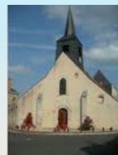
Notre-Dame de Lorris

Le mardi de 10 h 30 à 11 h 30 et le samedi de 10 h. à 12 h.