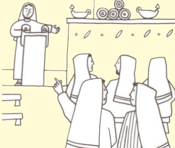
Jésus lisant dans une synagogue

Pour prendre soin des fruits délicats, elles avaient une technique bien rôdée : elles chargeaient des couffes (paniers de 20 kg) pour passer la marchandise d'un train à l'autre. Cette besogne était très pénible.