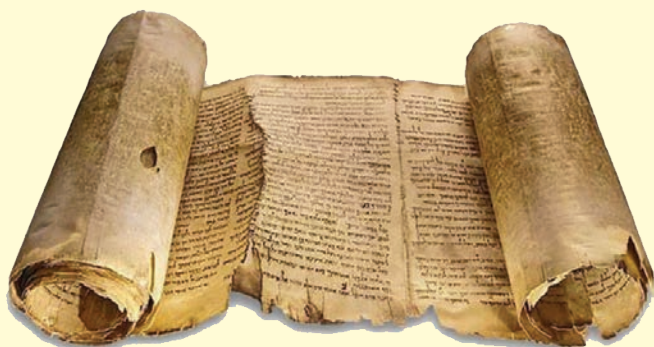
Un rouleau d'Isaïe retrouvé à Qumran.