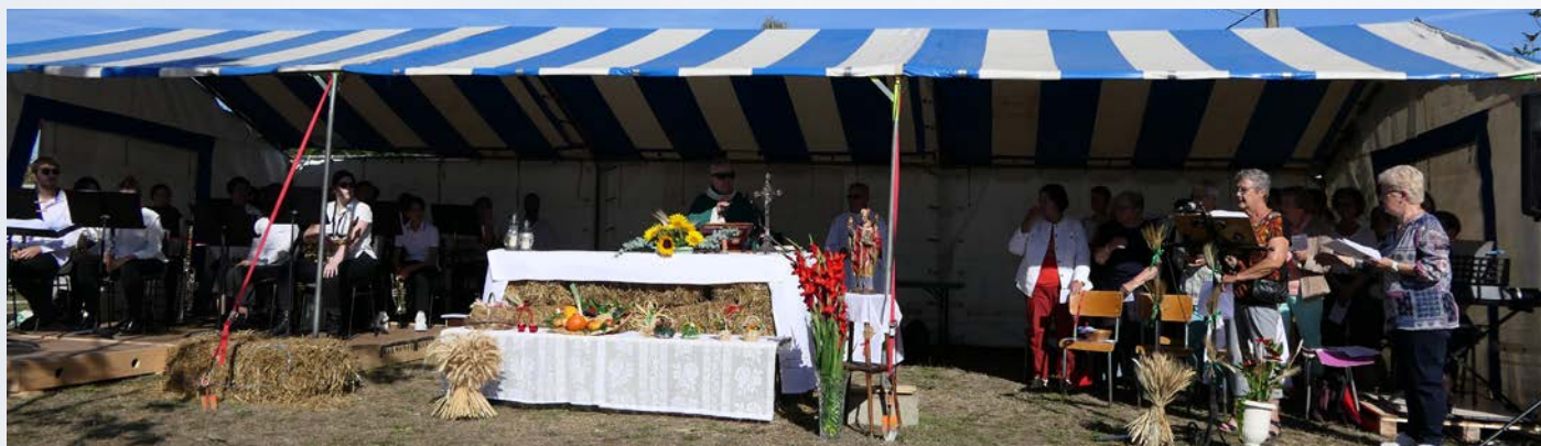
Une première réussie pour la 95 e fête des moissons à Gidy célébrée en extérieur sous un soleil radieux.