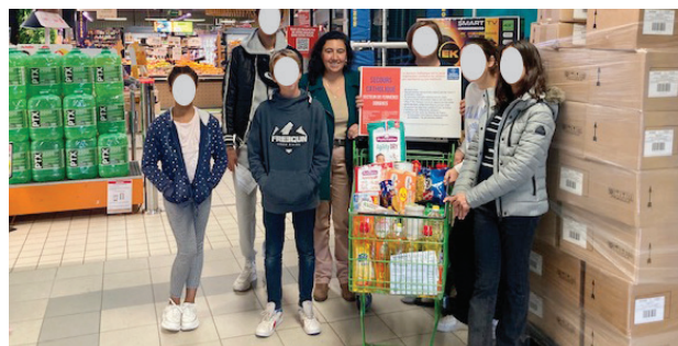
Collecte pour « la boîte en plus » avec le Secours Catholique le 15 octobre 2022 à l'Intermarché de Dordives.