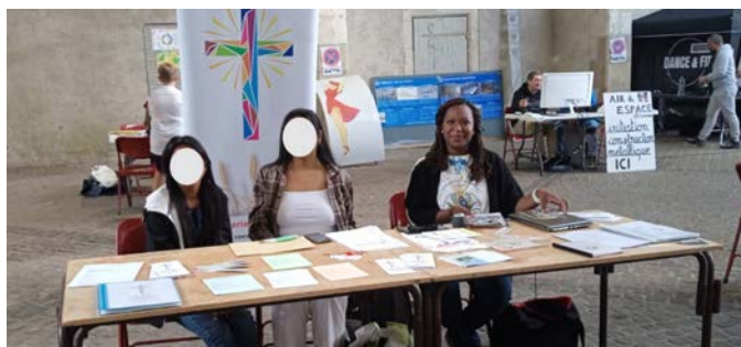
Stand de l'aumônerie au Forum des associations le 10 septembre 2022 à Courtenay.

Ce cheminement ne se fait pas « hors sol » mais au sein des communautés locales. C'est pourquoi les animateurs(trices) travaillent avec les Equipes d'Animation Pastorales, les mouvements d'Église, les prêtres et religieuses, les paroissiens, les associations et les mairies locales. Les jeunes animent quelques messes les dimanches, participent à des forums associatifs, présentent leurs activités, participent à des actions caritatives.