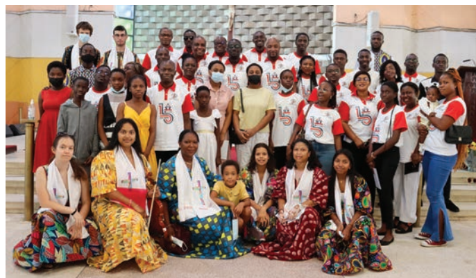
Photo de groupe avec les jeunes de la paroisse Sainte Cécile à Abidjan en Côte d'Ivoire ▼

Parce que grandir dans la foi c'est aussi aller vers l'autre, de qui nous pouvons avoir peur par « méconnaissance », l'aumônerie a entrepris de faire partir les jeunes à la découverte d'autres cultures. Cette année, ce sont 8 jeunes et 2 accompagnatrices qui se sont rendus pendant 15 jours en Côte d'Ivoire, pays ouest africain. Durant ce pèlerinage, ils ont rencontré les communautés chrétiennes, célébré des messes, vécu des moments de recueillement et de prière, visité des lieux saints, entre autres la basilique Notre Dame de la Paix de Yamoussoukro. Avec l'aide et la générosité des paroissiens, l'aumônerie a offert des dons d'une valeur globale de 3000 euros à un orphelinat, une maternité et une centaine de collégiens et lycéens ivoiriens. Un grand merci à TOUS pour cela. Ce séjour est le premier d'une longue série de voyages à l'étranger qui pourront être organisés chaque année. La prochaine destination prévue est le Canada en été 2023.