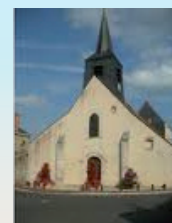
Notre-Dame de Lorris

Le mardi de 10 h 30 à 11 h 30 et le samedi de 10 h. à 12 h.