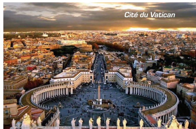
Cité du Vatican

Selon le secrétaire du pape, dans des déclarations recueillies par Vatican News ce vendredi 25 janvier, les personnes présentes dans la basilique romaine ont répondu par un silence absolu, sans applaudissements. L'étonnement s'est répandu parmi tous les cardinaux en écoutant la matérialisation d'un travail qui semblait incompréhensible et qui avait été reporté depuis de nombreuses années.