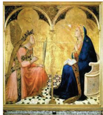
Le Oui de Marie Ambrogio Lorenzetti

Dans des situations aussi dramatiques, il faut être très fort dans sa tête pour faire confiance en l'avenir. Il me semble que croyant ou non, on doit faire appel à quelque chose qui nous dépasse. On s'en remet « à la grâce de Dieu ». Mais il faut oser s'en remettre à l'autre, lui dire « OUI » sans savoir exactement où cela va nous mener. On s'engage à prendre un risque car l'issue est incertaine.