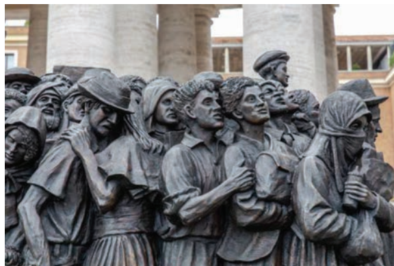
Cette sculpture : « Angels Unawares » regroupe 140 personnes.

Nous non plus au début, puis grand-père a cherché. Voici d'autres photos dont une où François vient de dévoiler cette sculpture en bronze de Timothy Schmalz qui représente des réfugiés et des migrants.