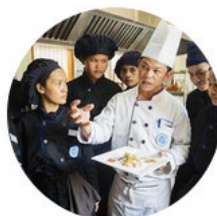
Former à un métier