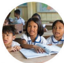
Eduquer et scolariser