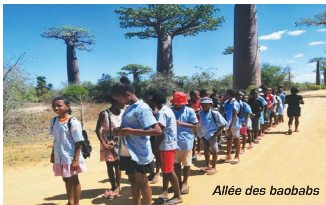
Allée des baobabs

Le but de l'association est d'être au plus proche de la population, et de travailler avec toutes les générations confondues.