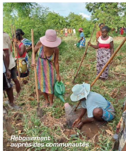
Reboisement auprès des communautés

avec la création de 6 pépinières plus d'un million de plants ont déjà été produit.