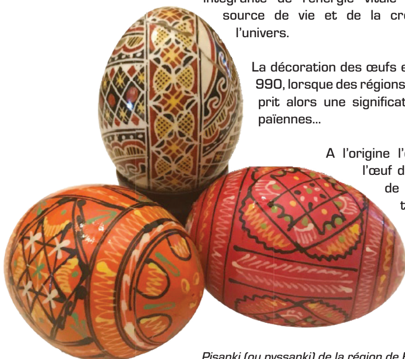
Pisanki (ou pyssanki) de la région de Bucovine (Roumanie)