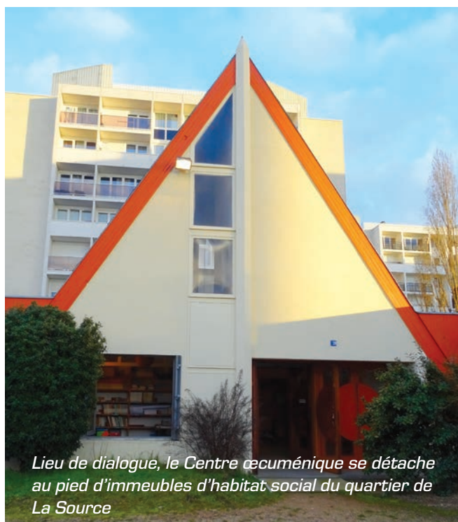
Lieu de dialogue, le Centre œcuménique se détache au pied d'immeubles d'habitat social du quartier de La Source