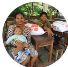
Aider les familles