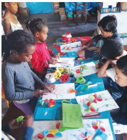
Activité découpage à l'une de nos bibliothèques