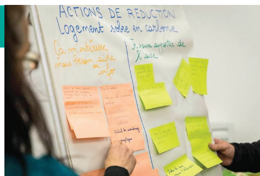
«Un moment des conversations carbone».

Je participe comme « facilitateur » à l'un de ces groupes, celui qui est parrainé par la commune de Chuelles et par le PETR (Pôle d'Equilibre Territorial et Rural). Nous nous préparons à la 6 ème et dernière réunion prévue en juin. Un nouveau cycle de ces Conversations Carbone sera organisé entre septembre et décembre 2023. D'autres suivront. Nous sommes invités à mesurer nos impacts et à identifier leur origine. Cela permet de sélectionner les actions les plus efficaces et les moins difficiles à mettre en œuvre. Le travail de groupe est très éclairant. Les réunions suivent un déroulé assez précis qui alterne des mises à niveau technique, des questionnements individuels, des échanges dans des conditions favorisant l'écoute et la compréhension mutuelle. Le déroulé des Conversations