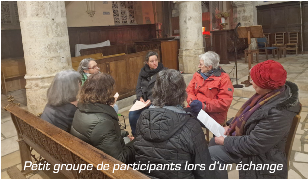
Petit groupe de participants lors d'un échange

Chaque mercredi de carême (soit 5 rencontres) une trentaine de personnes du secteur paroissial Ste Rose-Ste Alpaix, Courtenay / Château-Renard, ont participé aux rencontres « Venez, discutons ! » qui ont abordé des thèmes de la vie de tout homme.