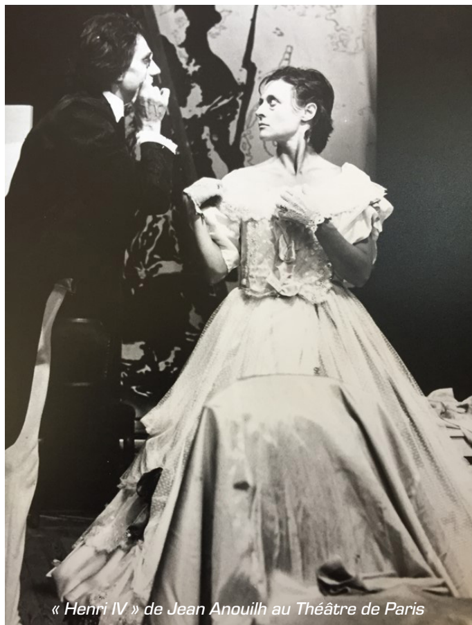
« Henri IV » de Jean Anouilh au Théâtre de Paris