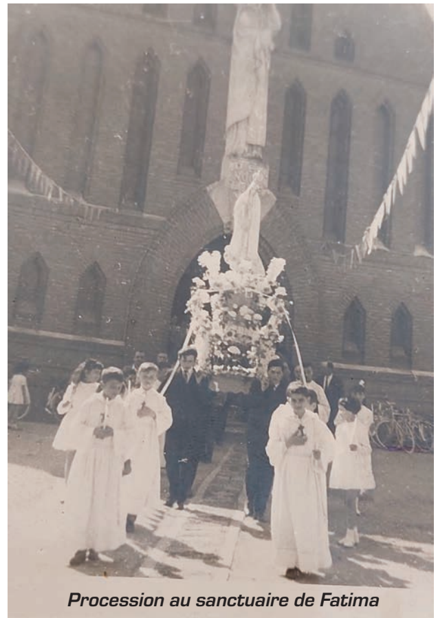
Procession au sanctuaire de Fatima

Le contexte est particulier, le monde est en guerre, mais le 13 mai 1917, date de la première apparition, puis tous les 13 de chaque mois, jusqu'au 13 octobre de la même année, [sauf en août où les enfants sont en prison] les trois cousins sont témoins de ce qu'ils supposent être la Vierge Marie.