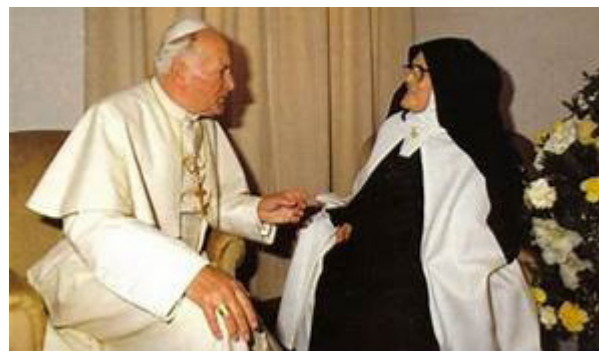
Sœur Lucie et Jean-Paul II en 1982

Mais sauvé de la mort un 13 mai, il ne pouvait plus éluder ce rendez-vous avec la Sainte Vierge, après trente et un mois de pontificat. Le 18 juillet 1981, le texte original du Secret et sa traduction en italien lui furent remis. Le 11 août suivant, il les fit rendre aux Archives de la Congrégation pour la doctrine de la foi. Le projectile qui a blessé grièvement Jean-Paul II est à sa demande, enchâssé dans la couronne de la statue de Notre-Dame de Fatima. Puisqu'elle a été touchée par la « main invisible de la Vierge », elle est devenue une relique.