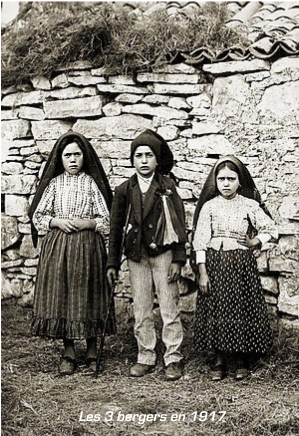
Les 3 bergers en 1917

Un peu d'histoire ? Pour tous les portugais, il est nul besoin de se remémorer l'histoire miraculeuse puisqu'elle est présente dans leurs cœurs et de tous ceux qui prient Marie !