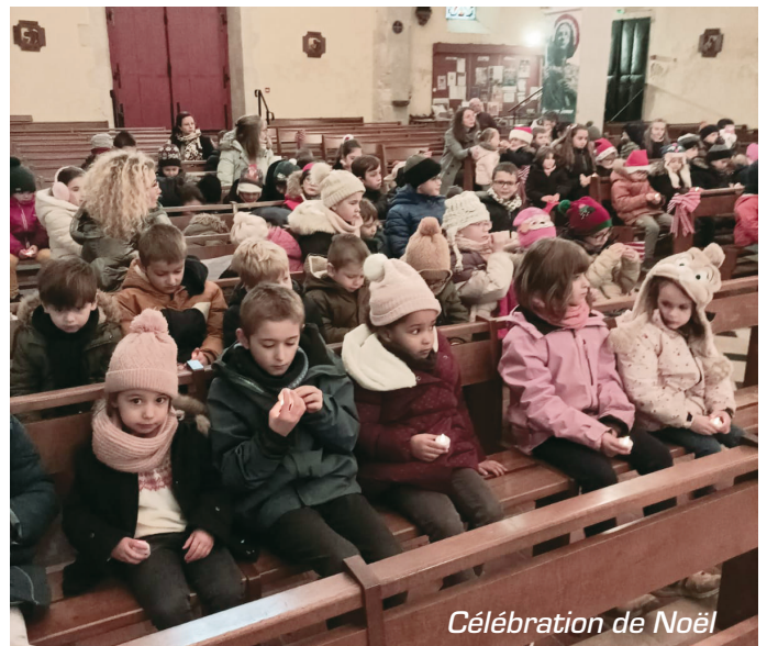
Célébration de Noël

Les élèves ont essayé d'être de bons relayeurs de bonnes actions : être attentif à l'autre, le respecter... pour pouvoir devenir relayeur de Lumière.