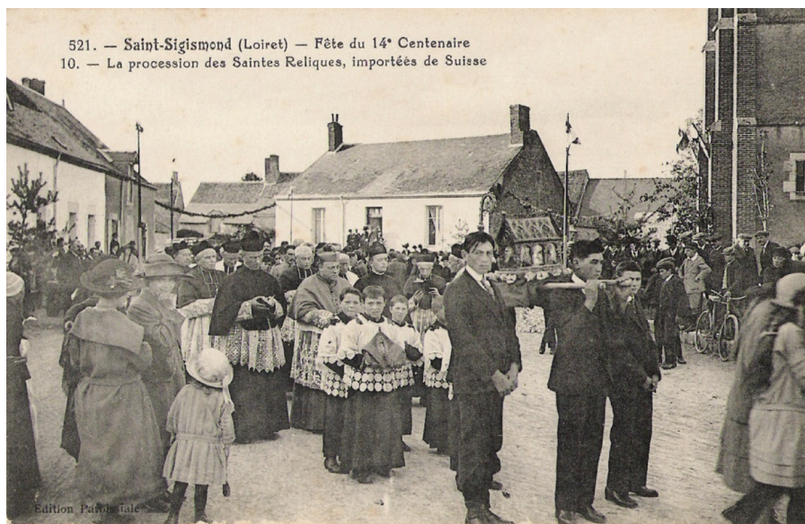
521. — Saint-Sigismond (Loiret) — Fête du 14 e Centenaire 10. — La procession des Saintes Reliques, importées de Suisse

Sigismond naquit vers 475. Son père était roi des Burgondes et sa mère, la princesse Careteine. Tous deux l'ont élevé dans des sentiments de grande piété. Sigismond épousa en premières noces Amalberge, fille du roi d'Italie qui lui donna deux enfants, donc Sigeric. A Genève, où se trouvait la cour, il se consacra au développement du catholicisme. Il fit rebâtir et agrandir l'abbaye de Saint-Maurice à l'emplacement d'un sanctuaire abritant les reliques de Maurice d'Agaune, martyr du III e siècle. Le monastère se situe à Saint-Maurice, dans le canton du Valais en Suisse.