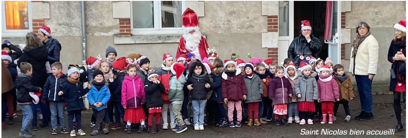
Saint Nicolas bien accueilli