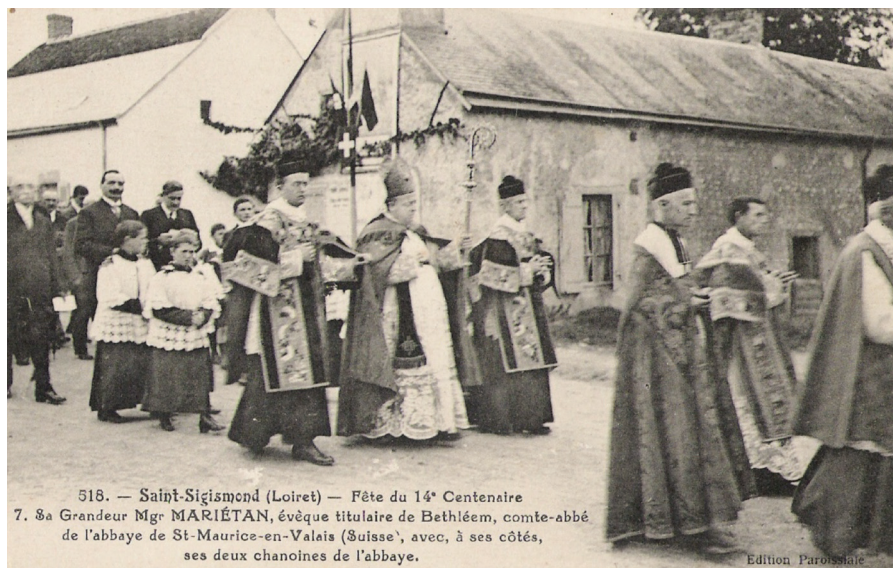
518. — Saint-Sigismond (Loiret) — Fête du 14 e Centenaire 7. Sa Grandeur Mgr MARIÉTAN, évêque titulaire de Bethléem, comte-abbé de l'abbaye de St-Maurice-en-Valais (Suisse), avec, à ses côtés, ses deux chanoines de l'abbaye.

Fête du 14 ème Centenaire. Sa Grandeur Mgr MARIÉTAN, évêque titulaire de Bethléem, comte-abbé de l'abbaye de Saint-Maurice-en-Valais (Suisse) avec, à ses côtés, ses deux chanoines de l'abbaye.