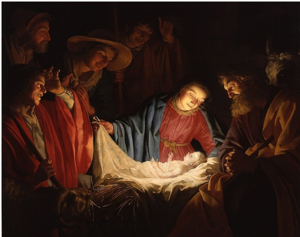
Gerrit van Honthorst (1592-1656), L'Adoration des bergers (huile sur toile, 1622), Musée régional de Poméranie, Greisfawald (Allemagne).

Mais à d'autres moments, elle demeure toute interdite et elle pense : « Dieu est là », et elle se sent prise d'une crainte religieuse pour ce Dieu muet, pour cet enfant, parce que toutes les mères sont ainsi arrêtées par moment, par ce fragment de leur chair qu'est leur enfant, et elles se sentent en exil devant cette vie neuve qu'on a faite avec leur vie et qu'habitent les pensées étrangères.