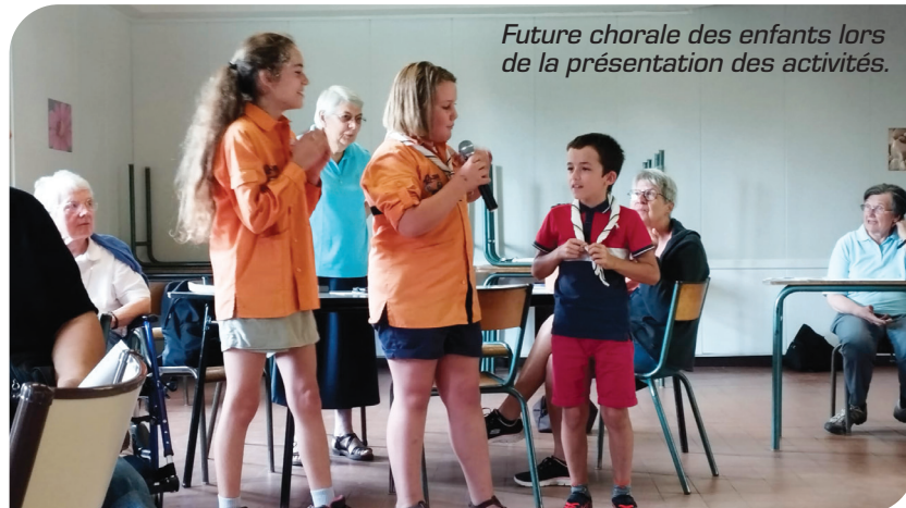
Future chorale des enfants lors de la présentation des activités.

Comme les disciples d'Emmaüs, nous avons marché en écoutant et partageant la parole, faisant connaissance avec des nouveaux arrivants, prié et partagé le pain lors du pique-nique au prieuré, chez les sœurs des campagnes.