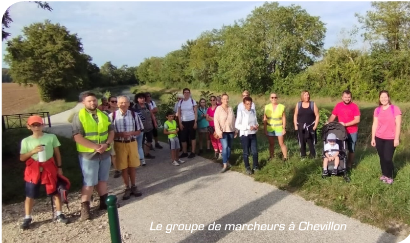
Le groupe de marcheurs à Chevillon

Samedi 16 septembre à Lombreuil avec un forum des activités paroissiales