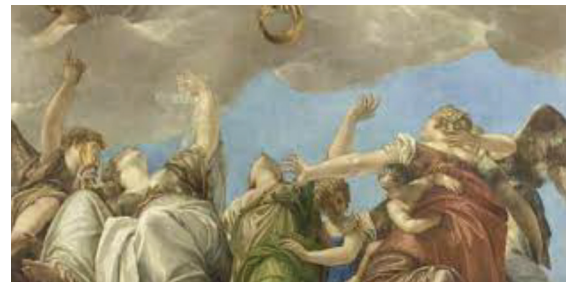
Véronèse : Saint Marc couronnant les vertus. Musée du Louvre.

Effrayant amour, effrayante charité, Effrayante espérance, responsabilité vraiment effrayante, Le Créateur a besoin de sa créature, s'est mis à avoir besoin de sa créature. Il ne peut rien faire sans elle. C'est un roi qui aurait abdiqué aux mains de chacun de ses sujets Simplement le pouvoir suprême. Dieu a besoin de nous, Dieu a besoin de sa créature. Il s'est pour ainsi dire condamné ainsi, condamné à cela. Il manque de nous, il manque de sa créature. Celui qui est tout a besoin de ce qui n'est rien Celui qui peut tout a besoin de ce qui n'est rien. Celui qui peut tout ne peut rien sans celui qui ne peut rien. Ainsi la jeune espérance reprend, remonte, refait, redresse tous les mystères comme elle redresse toutes les vertus. Nous pouvons lui manquer: Ne pas répondre à son appel. Ne pas répondre à son espérance. Faire défaut. Manquer. Ne pas être là. Effrayant pouvoir.