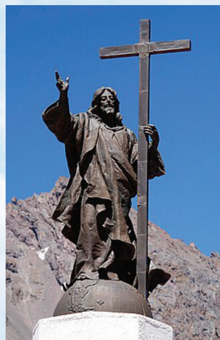
Christ Rédempteur des Andes